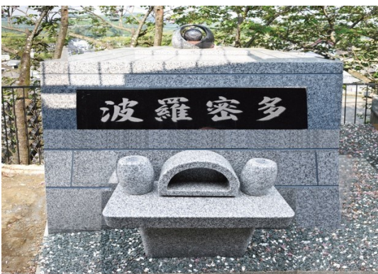
徳雲寺（曹洞宗） 八王子市元八王子町 3-2382 (南多摩霊園内)