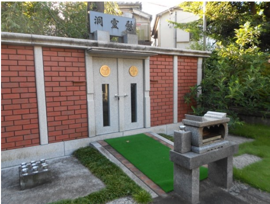
定泉寺（浄土宗） 文京区本駒込 1-7-12